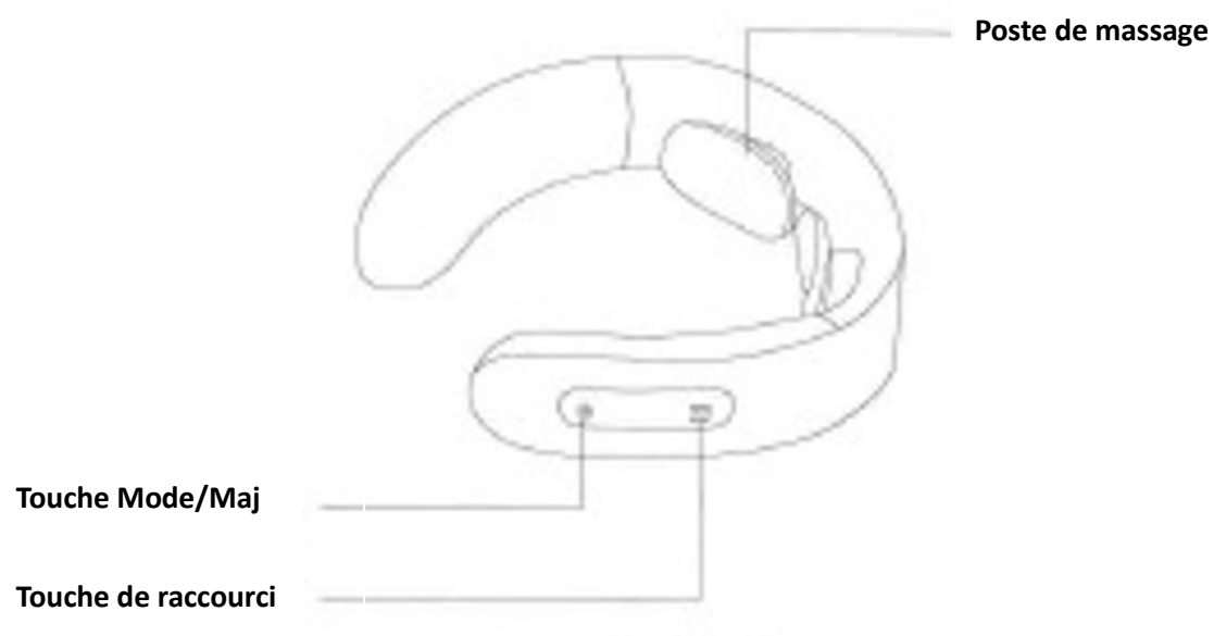
Diagramme du produit